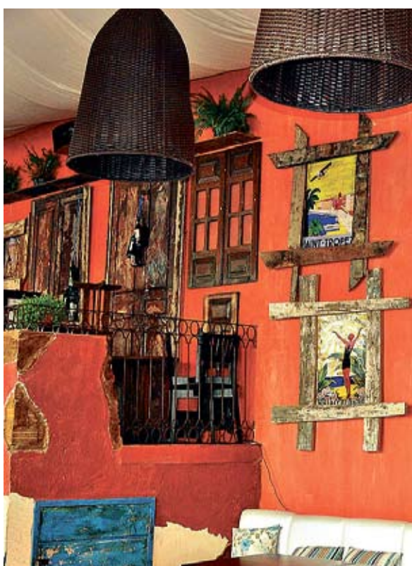
Para o Saint Tropez Bar Perlla e Júnior foram buscar inspiração nos bares do Sul da Riviera Francesa

Showroom Dellano: o talento da dupla de arquitetos também está presente em grandes empreendimentos de marcas nacionais. Um dos projetos que está se tornando referência nacional é o da Loja Dellano. Este ano os dois arquitetos trabalharam para o ambiente um conceito internacional, com direito a reprodução de uma galeria de arte em preto e branco. Foram oito meses de estudo para montar o ambiente, mas, quando for inaugurado em novembro, promete surpreender.